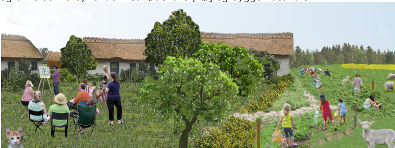
Første Grokraft Natur-højskole skal ligge på Vest-Sjælland.

Hvis vi standser det nuværende landbrug, der producerer kød til 50 millioner mennesker – er det muligt for mange (måske alle) – hvis man vil - at flytte på landet og blive selvforsynende med fødevarer, tøj og byggematerialer.